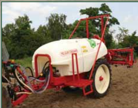
Pelikan STANDARD 2000