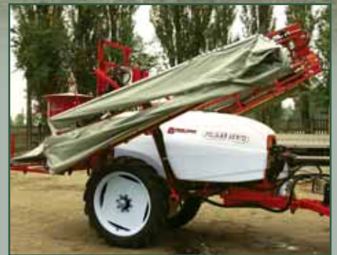
Pelikan VENTO 1500

Opryskiwacze PELIKAN 1000, 1500 i 2000 przeznaczone są do wykonywania zabiegów ochrony roślin w gospodarstwach o średnim areale uprawowym. Spełniają one wymogi nowoczesnego rolnictwa, jak również ustawy o ochronie roślin i środowiska. Do budowy tych opryskiwaczy użyto podzespołów renomowanych firm.